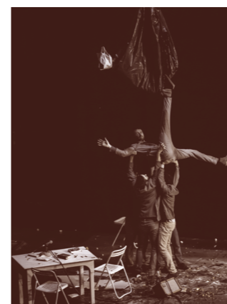
OPTRAKEN © Nicolas Martinez