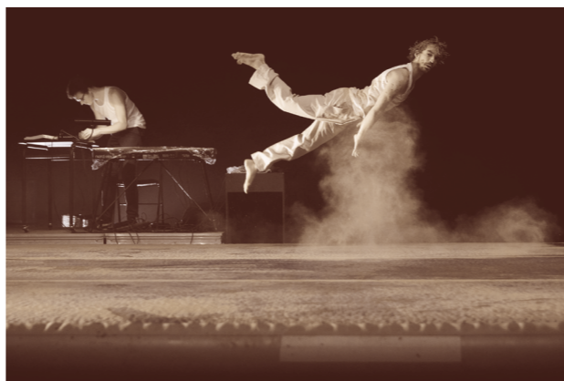
Acte II « K »