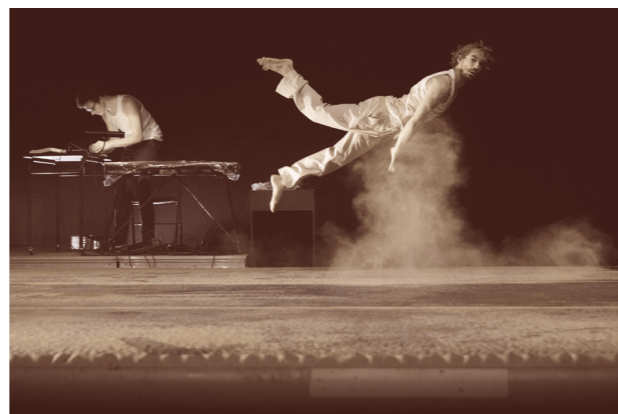
Acte II « K »

Dispositif Premières Pistes / utoPistes 2018 En partenariat avec les Subsistances, Laboratoire international de pratique et de création artistique