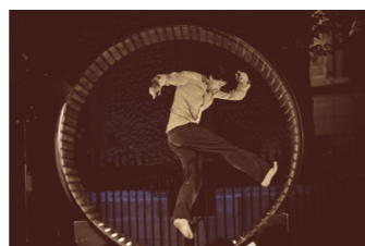
La Marche