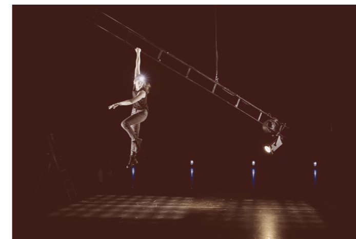
Noir M1