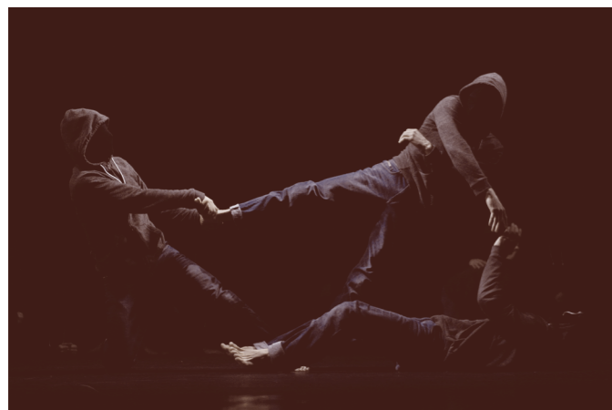
La Mécanique des Ombres