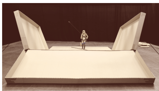
Maison Mère